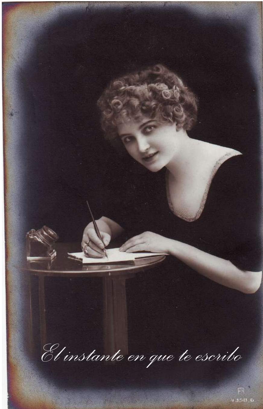
El instante en que te escribo

Una carta guarda el tiempo detenido de un instante, en algunas especialmente, pues hay cartas donde la persona describe con minuciosidad ese preciso momento de escribirla y sus circunstancias. Ese detalle, por contar el instante en el que se coge la pluma, convierte a esas líneas en un testimonio único, especial, real, en una fotografía en palabras. Entre las miles de cartas que guardamos en nuestro Museo de la Escritura Popular hemos recogido estos fragmentos como si estuviéramos cerniendo las cartas con un cedazo, para que se nos cribaran estos momentos únicos.